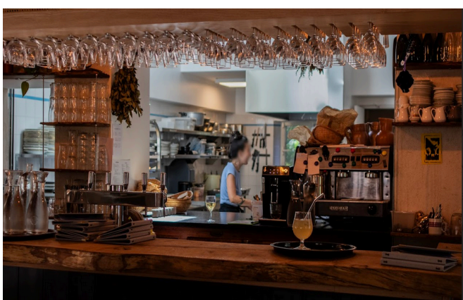
Bar ouvert sur salle 1 et cuisine