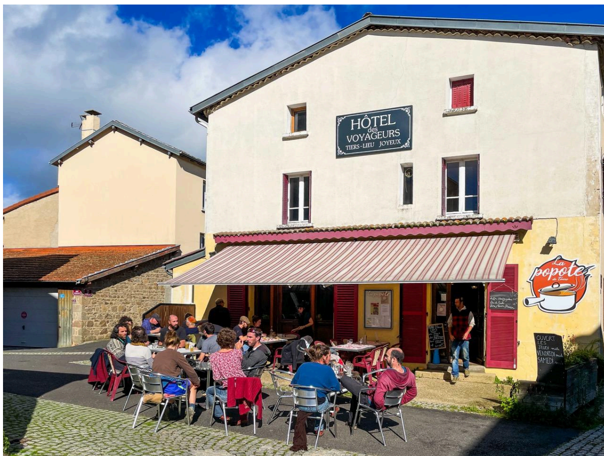
L'Hôtel des Voyageurs, bar-restaurant et espace multiactivités à Tours-sur-Meymont (530 habitants), dans le Puy-de-Dôme

La coopérative Villages Vivants est agréée Entreprise Solidaire d'Utilité Sociale et bénéficie depuis 2024 du label Finansol, qui garantit la solidarité et la transparence du produit d'épargne.