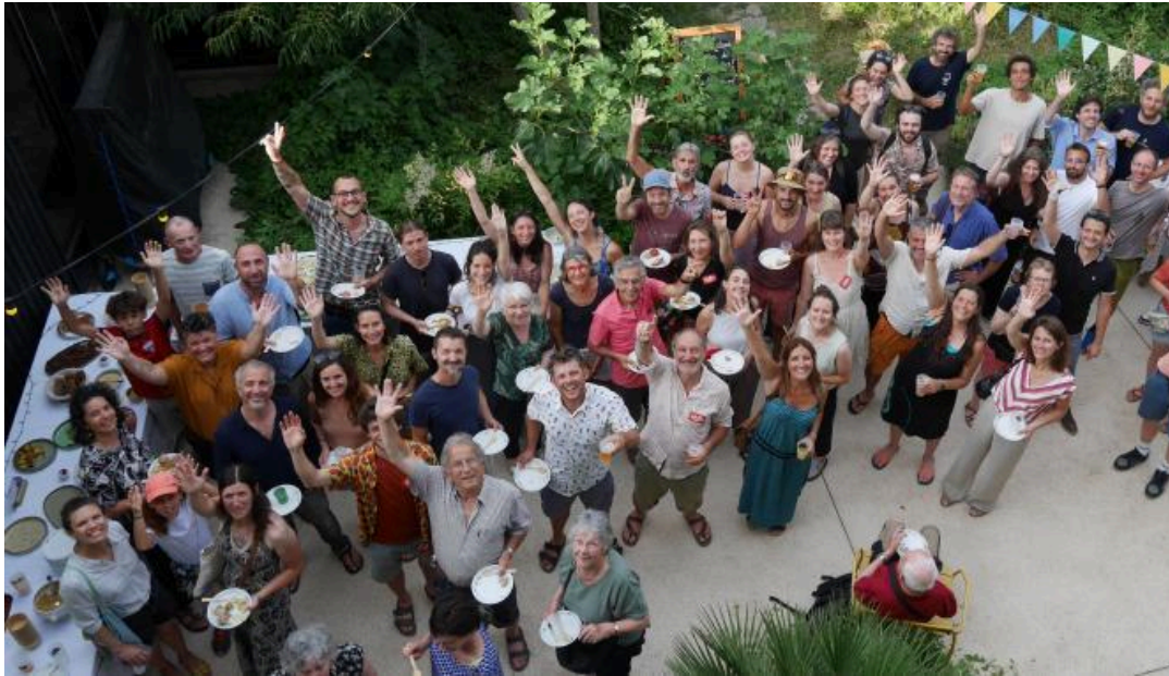
AG 2025 de Villages Vivants

renouvelée envers les actions de Villages Vivants. Nous les en remercions chaleureusement ! Sans eux, rien ne serait possible.