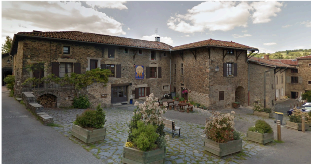
Future Auberge paysanne Les Tablées, à Riverie (69)